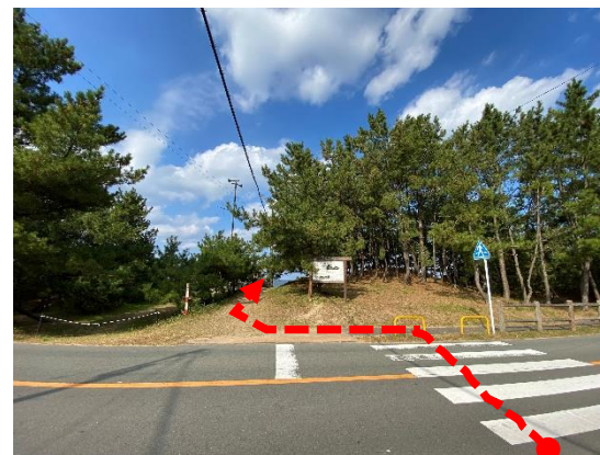
駐車場から海岸へのルート