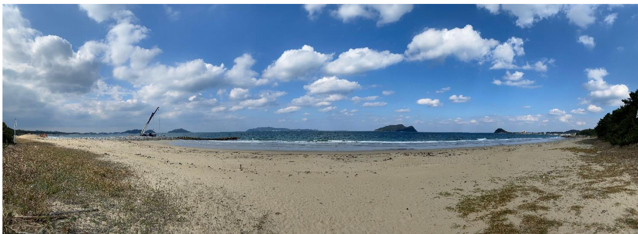
対象地（さつき松原海岸①）