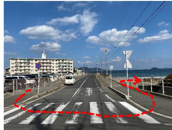
駐車場から海岸へのルート