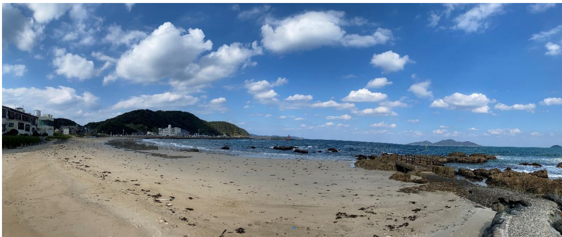
対象地（神湊漁港周辺海岸）