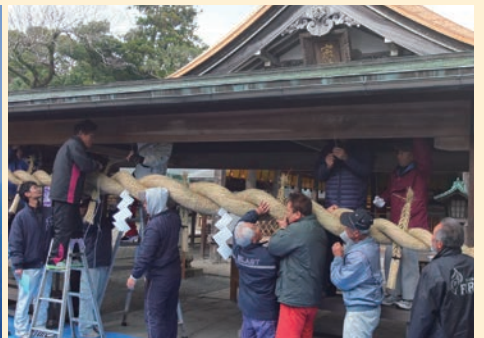
(辺津宮拜殿のしめ縄掛け替え奉仕の様子)